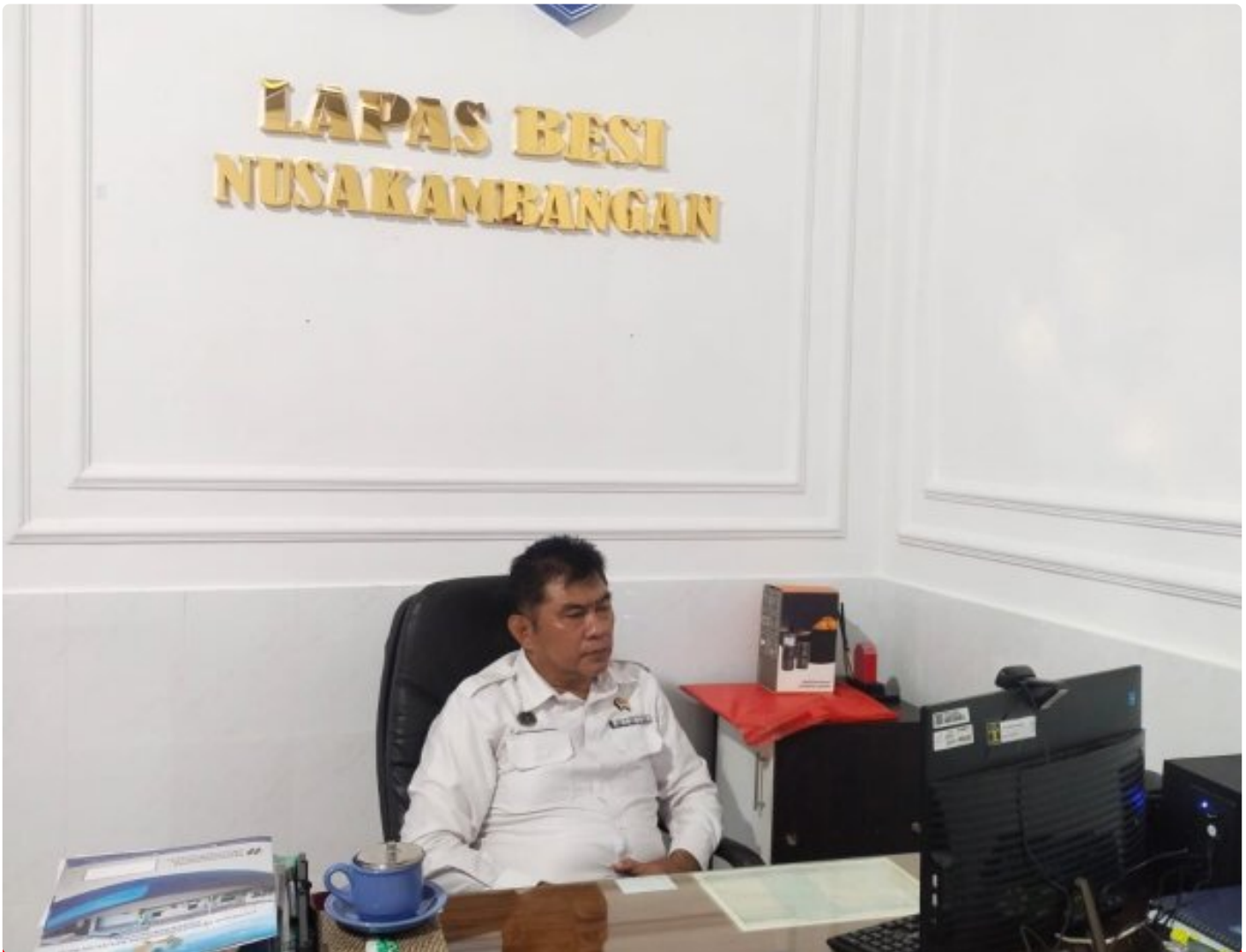
Dorong Akuntabilitas, Lapas Besi Ikuti Rakor Pengendalian Kinerja Imipas

Cilacap – Lapas Kelas IIA Besi Nusakambangan mengikuti Rapat Koordinasi Pengendalian Capaian Kinerja Semester II Tahun 2025 yang diselenggarakan oleh Kementerian Imigrasi dan Pemasarakatan secara daring melalui Zoom Meeting, pada Senin, 15 Desember 2025.