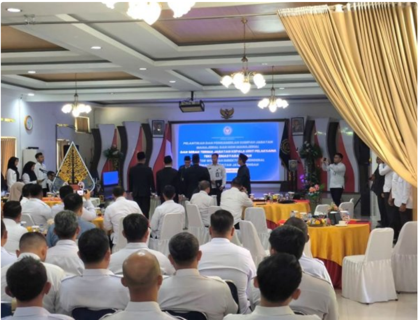
Kalapas Magelang hadir Pelantikan Tiga Pejabat Manajerial dan Non Manajerial di Nusa Kambangan

Cilacap - Kepala Lembaga Pemasyarakatan (Kalapas) Kelas IIA Magelang menghadiri pelantikan dan pengambilan sumpah jabatan tiga pejabat manajerial dan non manajerial yang dilaksanakan di Nusakambangan, Sabtu (20/12/2025).