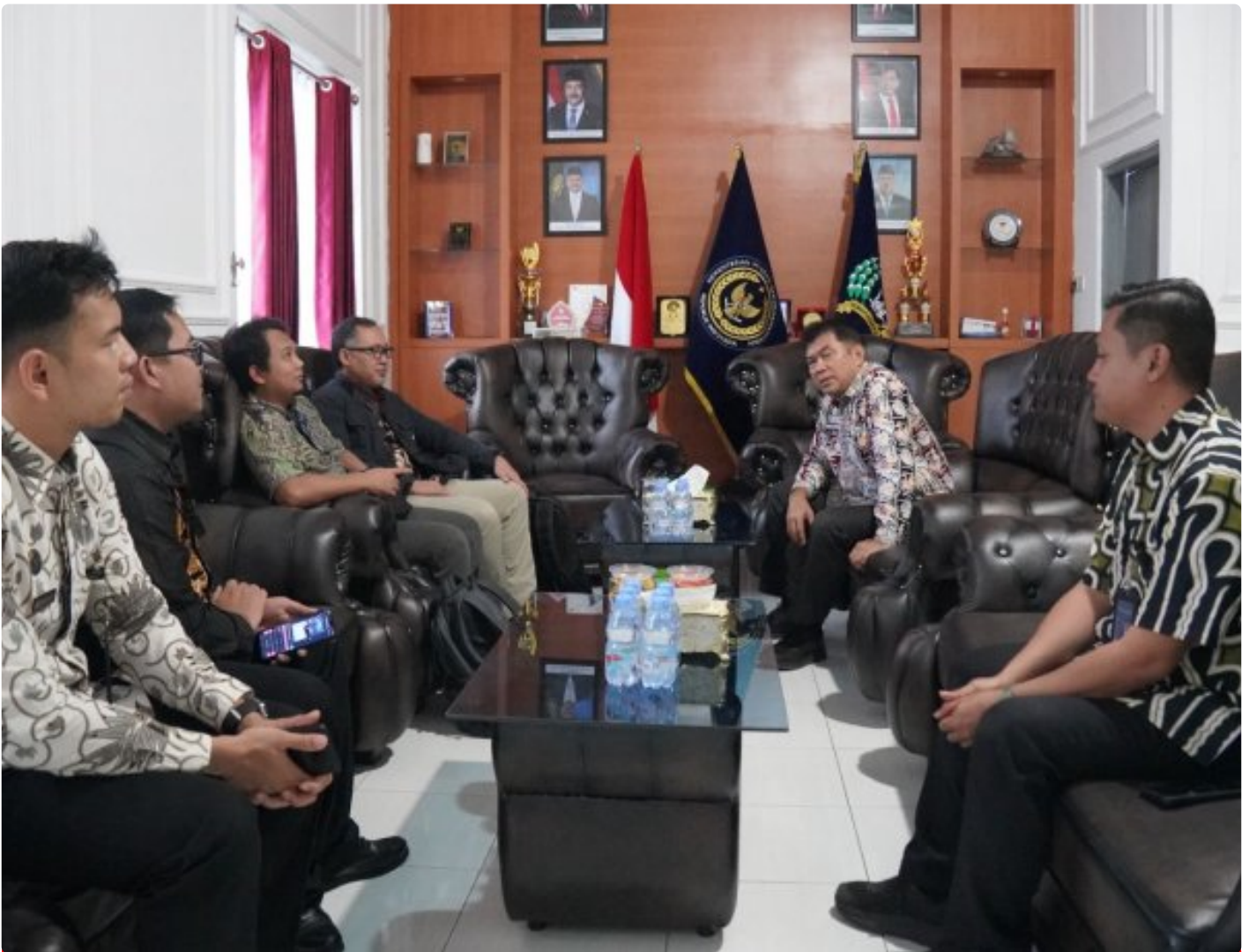
Komitmen Akuntabilitas, Lapas Besi Terima Kunjungan BPK

Cilacap – Lapas Kelas IIA Besi Nusakambangan menerima kunjungan tim Badan Pemeriksa Keuangan (BPK) RI pada Jumat, 12 Desember 2025, dalam rangka pemeriksaan reguler terhadap pengelolaan anggaran, administrasi, dan layanan dasar di Lapas Besi.