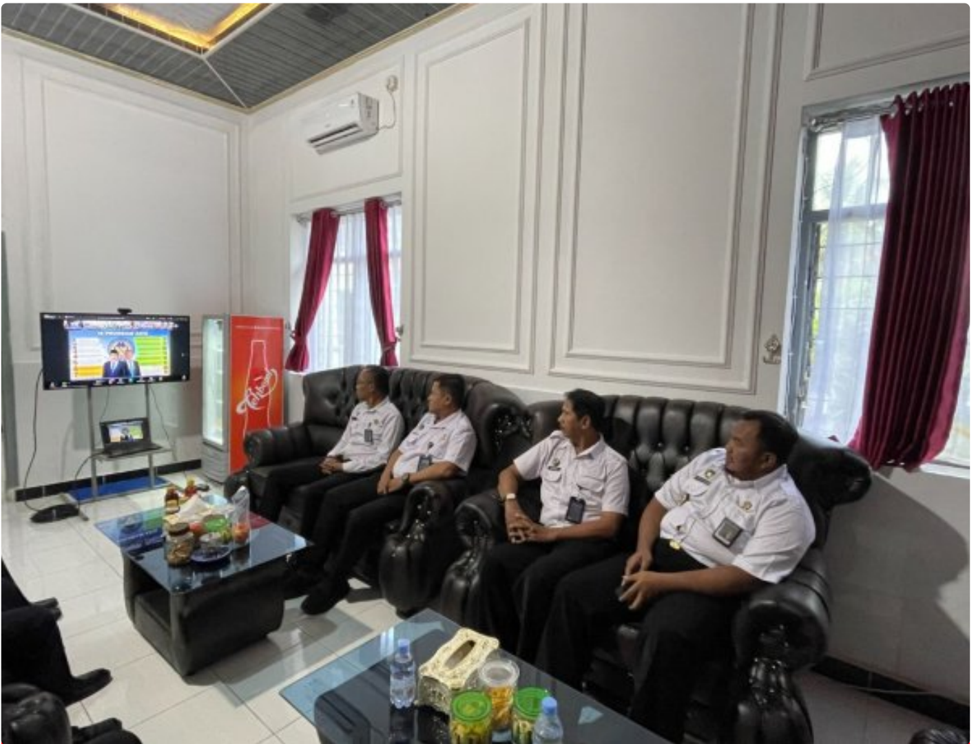
Lapas Besi Nusakambangan Mantapkan Langkah Hadapi KUHP dan KUHP Baru

Cilacap – Lembaga Pemasyarakatan (Lapas) Kelas IIA Besi Nusakambangan mengikuti kegiatan. Pengarahan Direktur Jenderal Pemasyarakatan terkait Pemberlakuan Kitab Undang-Undang Hukum Pidana (KUHP) Tahun 2023 dan Kitab Undang-Undang Hukum Acara Pidana (KUHP) Tahun 2025 pada Bidang Pelayanan Tahanan yang dilaksanakan secara virtual pada Selasa, 6 Januari 2026.