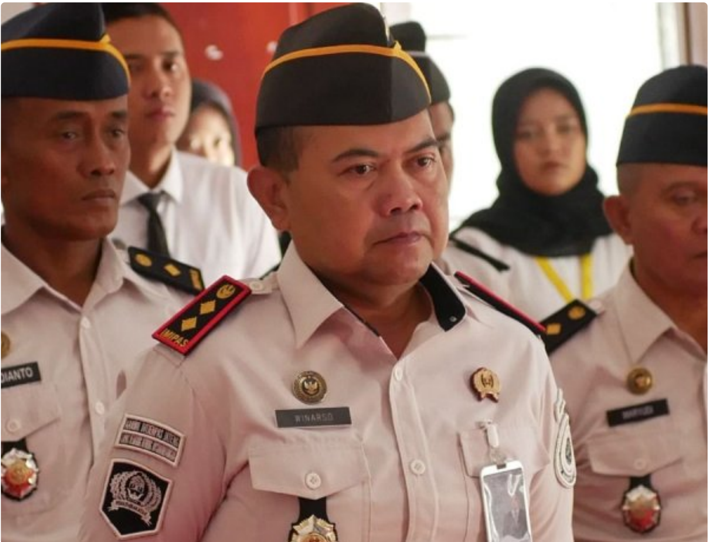
Lapas Kelas IIA Kembang Kuning Ikuti Apel Bersama Awal Tahun 2026 Kemenko Kumham Imipas

Cilacap – Lembaga Pemasyarakatan (Lapas) Kelas IIA Kembang Kuning mengikuti Apel Bersama Awal Tahun 2026 yang diselenggarakan oleh Kementerian Koordinator Bidang Hukum, HAM, Imigrasi, dan Pemasyarakatan (Kemenko Kumham Imipas), Senin (12/01/2026).