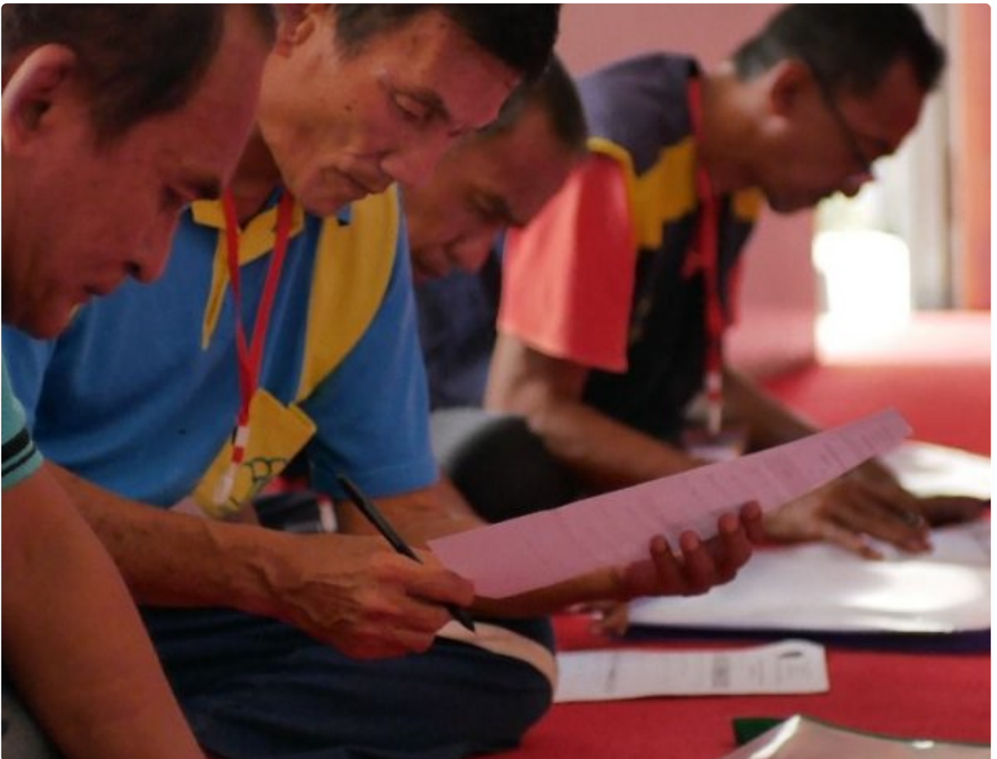
Lapas Kelas IIA Kembang Kuning Laksanakan Rehabilitasi Sosial Bersama BNN Kabupaten Cilacap

Cilacap - Lapas Kelas IIA Kembang Kuning bekerja sama dengan Badan Narkotika Nasional Kabupaten (BNNK) Cilacap melaksanakan kegiatan rehabilitasi sosial bagi Warga Binaan Pemasyarakatan (WBP), sebagai bagian dari upaya pembinaan dan pemulihan bagi WBP penyalahguna narkotika, Senin