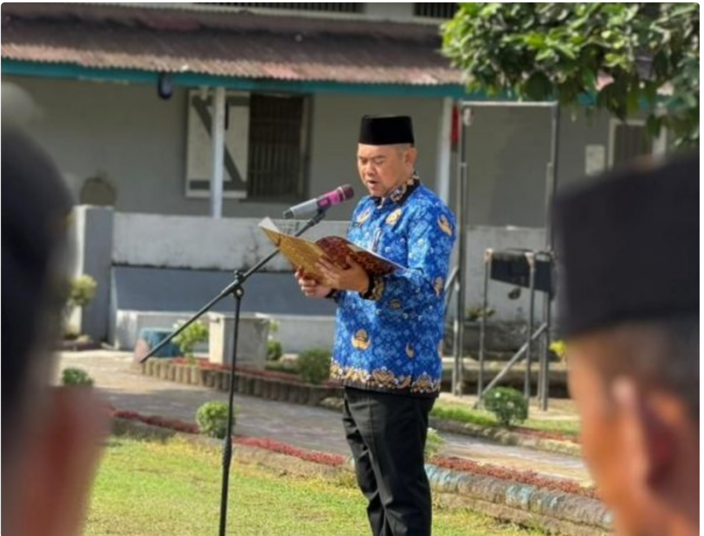
Lapas Kembang Kuning Gelar Upacara Peringatan Hari Bela Negara ke-77 Tahun 2025

Cilacap – Lembaga Pemasyarakatan (Lapas) Kelas IIA Kembang Kuning melaksanakan Upacara Peringatan Hari Bela Negara ke-77 Tahun 2025 dengan khidmat di lapangan upacara Lapas Kembang Kuning, Jumat (19/12/2025).