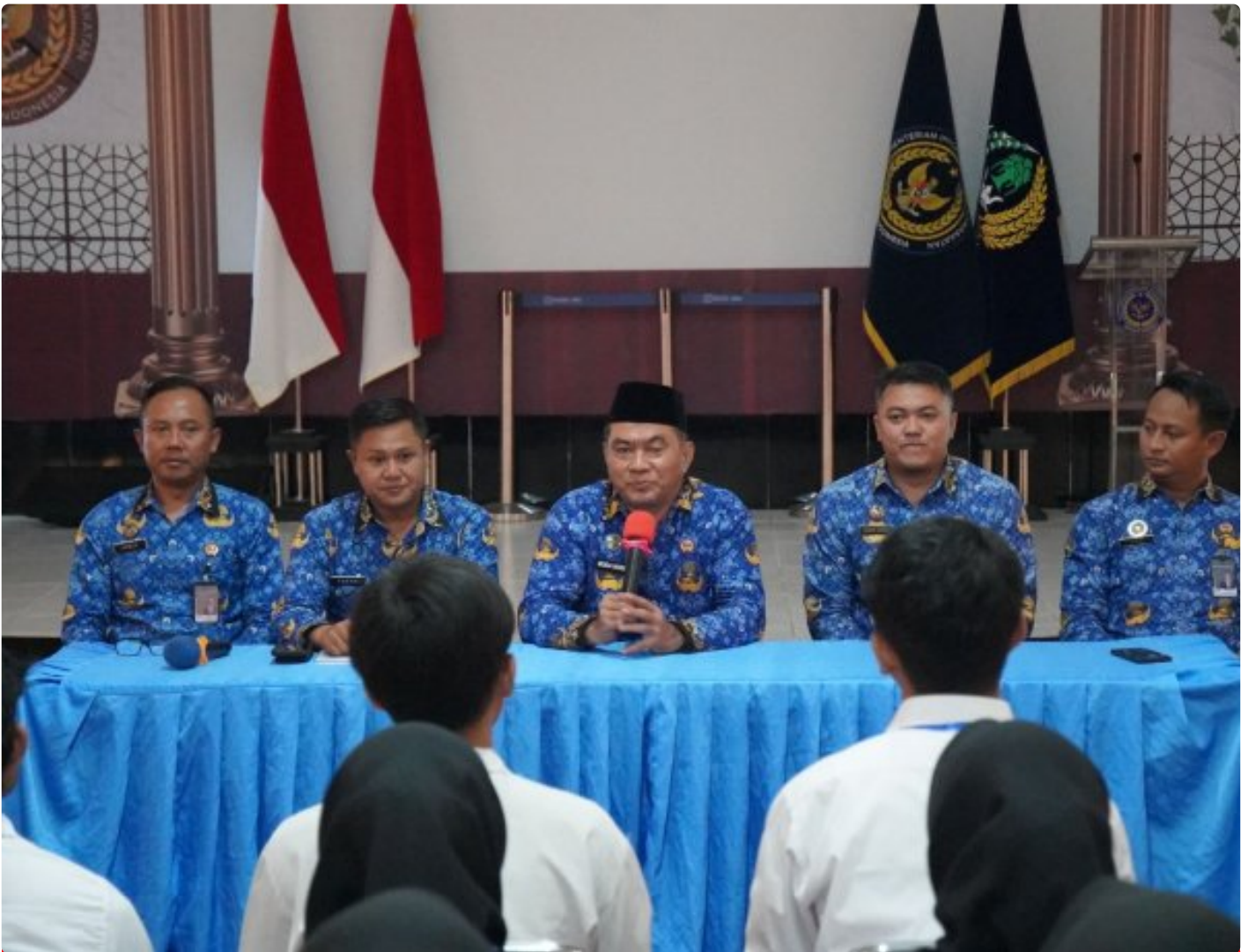
Magang dimulai, Peserta siap hadapi Tantangan Dunia Pemasyarakatan

Cilacap – Lapas Kelas IIA Besi Nusakambangan resmi memulai hari pertama pelaksanaan pemagangan Batch 2 pada Senin, 1 Desember 2025, setelah para peserta menjalani masa orientasi bersama seluruh peserta magang se-Nusakambangan selama satu minggu sebelumnya.