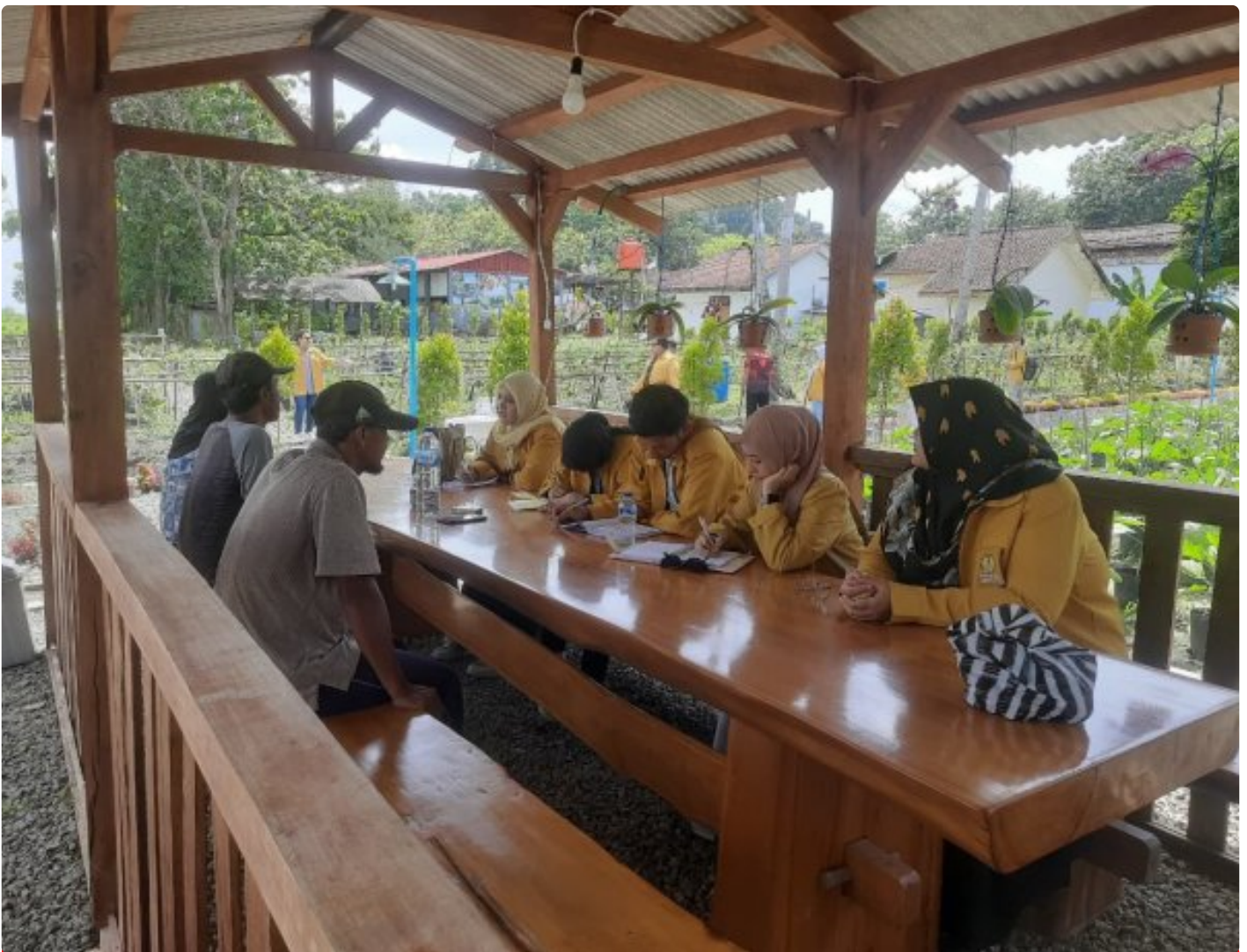
Mahasiswa Program Magister Unsoed Laksanakan Kunjungan Akademik ke Lahan Pertanian dan Peternakan Lapas Kelas IIA Kembang Kuning

Cilacap - Lapas Kelas IIA Kembang Kuning menerima kunjungan akademik dari