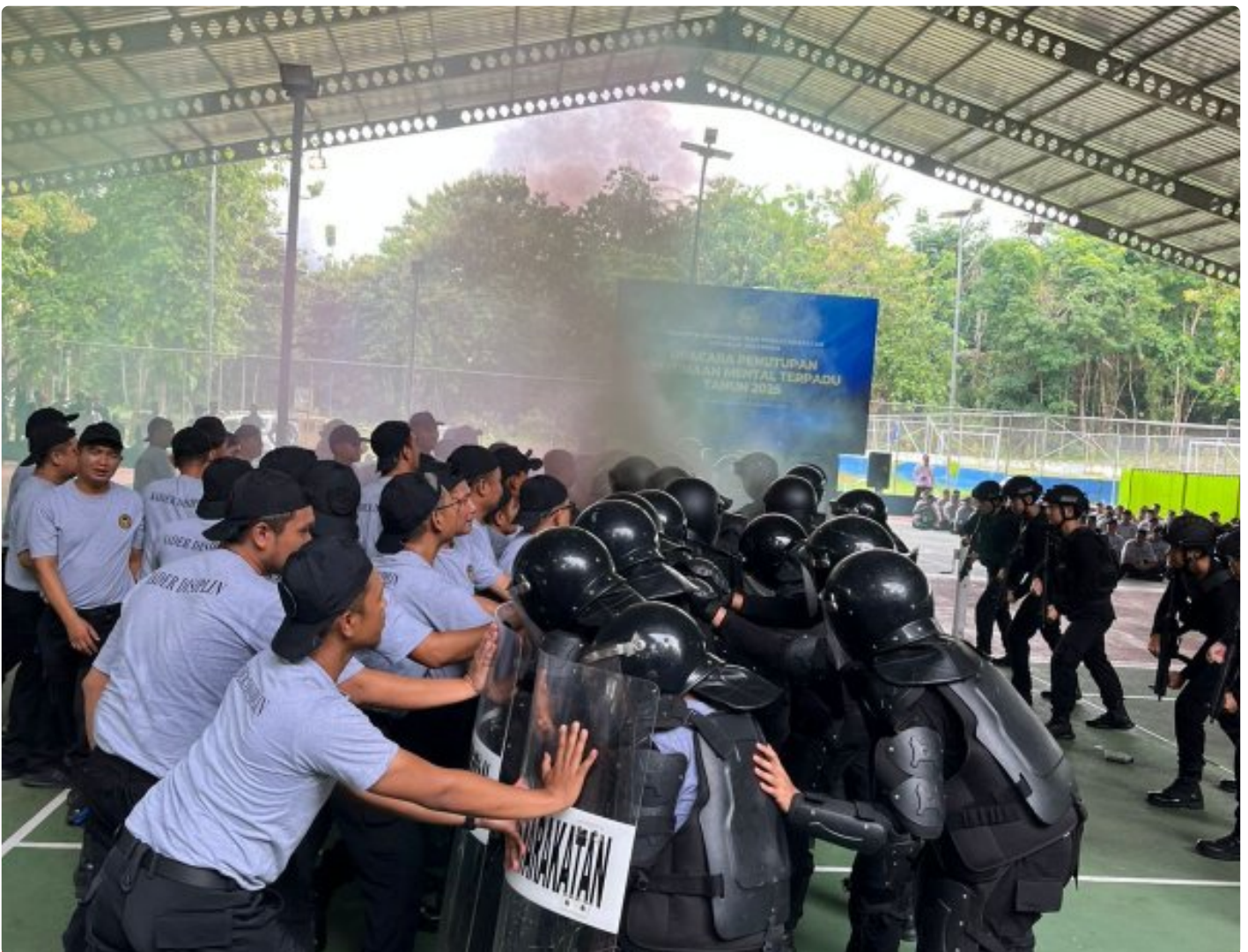
Penutupan Pembinaan Mental Terpadu 2025, Kalapas Kembang Kuning hadir dan berikan Apresiasi

Cilacap – Kegiatan Pembinaan Mental Terpadu Tahun 2025 resmi ditutup, kegiatan bertempat di Lapangan Tenis Nusakambangan. Program yang telah berlangsung selama satu bulan penuh ini diikuti oleh pegawai Pemasyarakatan dan Imigrasi dari berbagai Unit Pelaksana Teknis (UPT) di seluruh Indonesia,