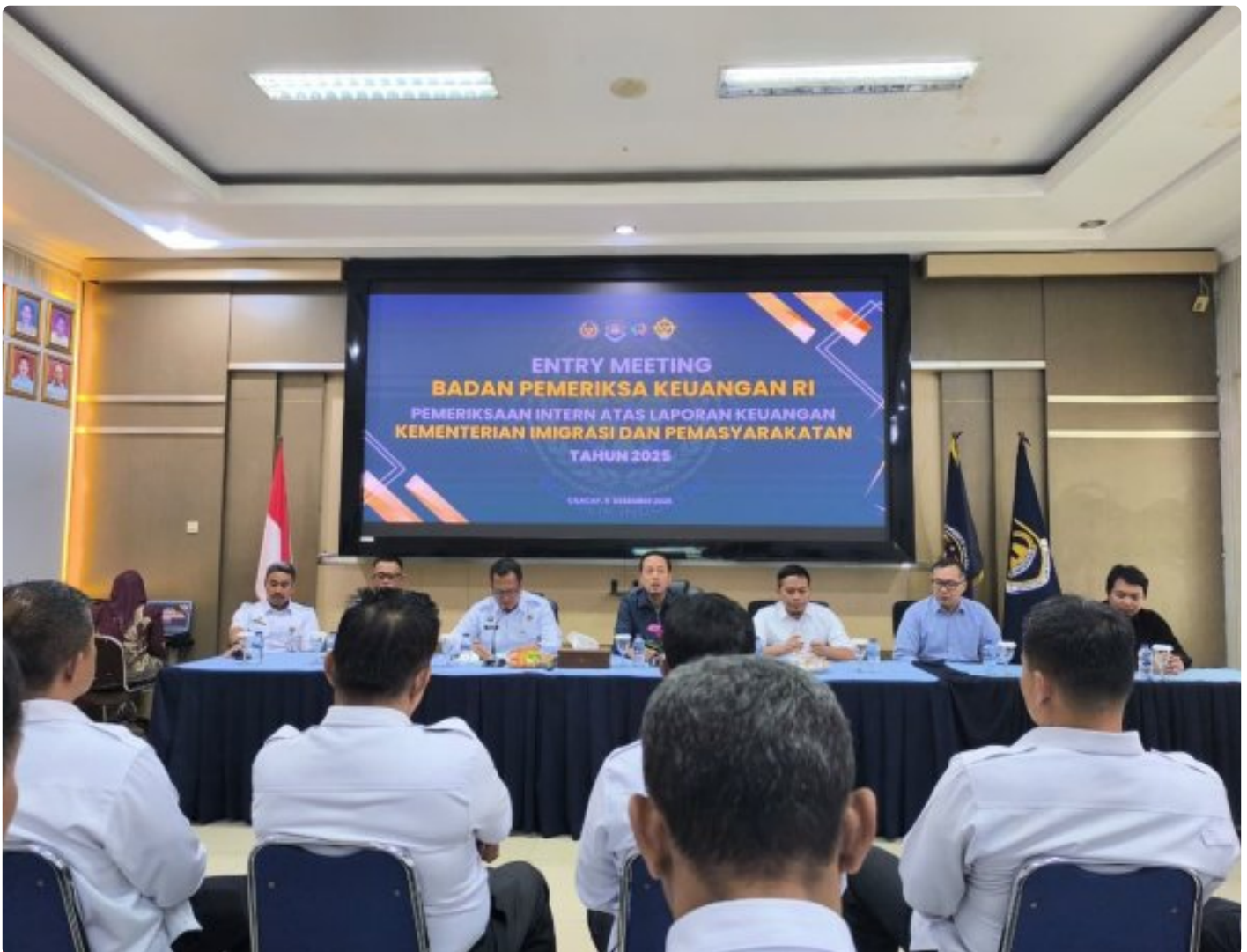
Pelaksanaan Entry Pemeriksaan Interim BPK terkait Laporan Keuangan Kemenimipas Tahun 2025 di Kanim Cilacap

Nusakambangan, 15 Desember 2025 – Balai Pemasyarakatan (Bapas) Kelas II Nusakambangan mengikuti kegiatan Entry Meeting Pelaksanaan Pemeriksaan Interim atas Laporan Keuangan Kementerian Imigrasi dan Pemasyarakatan Tahun 2025 yang diselenggarakan di Aula Kantor Imigrasi Kelas I TPI Cilacap.