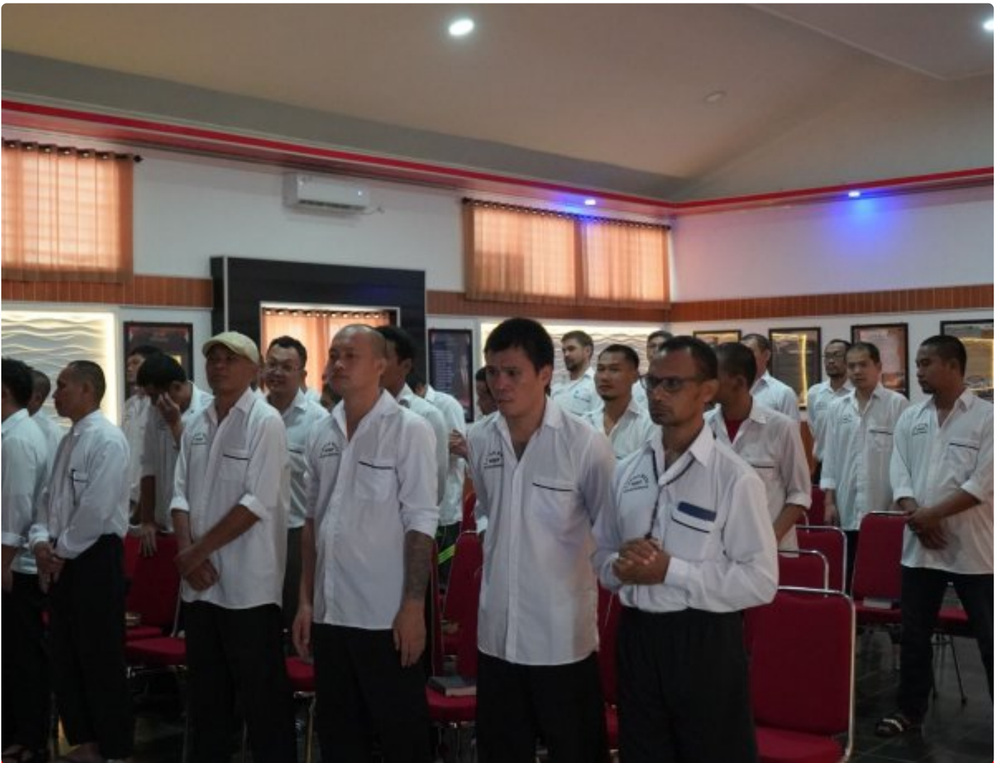
Perkuat Iman dan Harapan, WBP Nasrani Lapas Besi Ikuti Ibadah Bersama

Cilacap – Sebanyak 39 Warga Binaan Pemasyarakatan (WBP) Nasrani Lapas Kelas IIA Besi Nusakambangan mengikuti kegiatan Ibadah Bersama bertema “Sungai Kehidupan” yang diselenggarakan secara virtual pada Selasa, 30 Desember 2025.