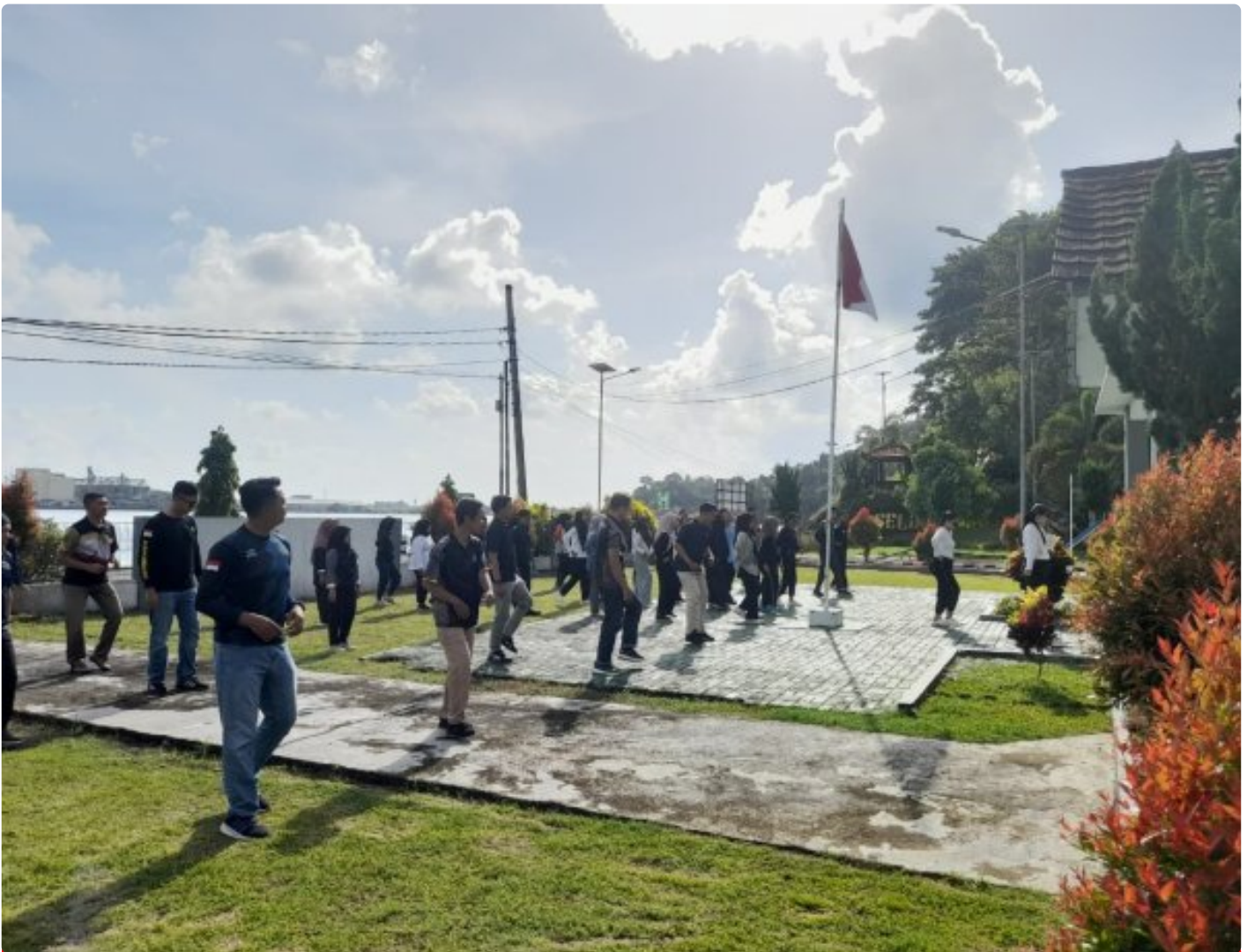
Senam Pagi Bersama Pegawai Bapas Nusakambangan untuk Memulai Kerja di Hari Jumat

Nusakambangan, 12 Desember 2025 – Balai Pemasyarakatan (Bapas) Kelas II Nusakambangan pada hari ini melaksanakan kegiatan Senam Pagi bersama yang diikuti oleh seluruh pegawai. Kegiatan berlangsung di halaman kantor Bapas Nusakambangan dan diikuti dengan penuh antusias sebagai bentuk komitmen untuk menjaga kesehatan jasmani serta membangun suasana kerja yang lebih segar dan produktif.